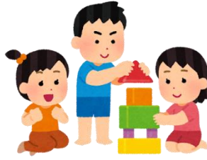
與朋友一起玩玩具